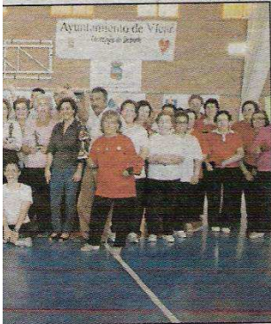
...cipal de La Gangosa.