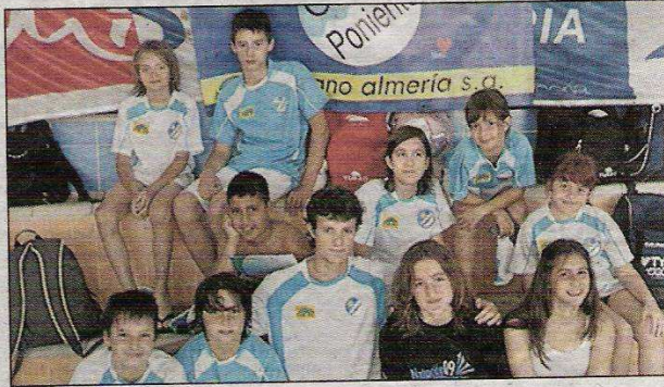
Secciones alevín y benjamín del C.N Poniente-Vícar-Halsa